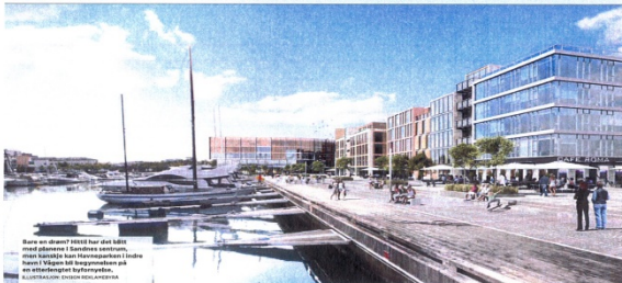
Bare en måned etter at det ble klart at Sandnes og Gjesdal, men kanskje kan Stavangeren i løse noen i tillegg til byutviklingen på en utbygget byrom.