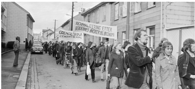
1975: Demonstrasjon mot sanering av Rodeløkka.

I manifestet oppfordret de til løsrivelse fra det de så som en rådende nasjonal sneverhet og som «coziness i stilen». I stedet burde en tenke universelt, ta i bruk ny teknikk, «gripe inn i fremtiden». Vi fikk 1960-tallets storskalatenkning og brutalisme. Vi fikk drabantbyer, høyhus, motorveier og kjøpesentra. Vi fikk industrialisert bygging og – en radikalt bedre boligstandard.