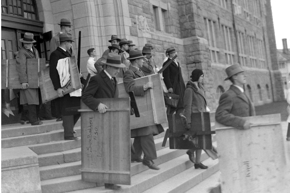
1930: Streikende studenter forlater høyskolen i Trondheim.