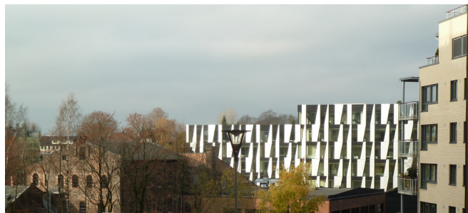
2021: Nyliberalistisk arkitektur. Individualisme uten tanke på omgivelsene.

Et nytt opprør bygget seg opp rundt 1970. Medvirkning, småskalatenkning, sosialt miljø og tradisjonell byggeskikk ble satt opp mot elitestyring, industrialisert masseproduksjon og høyhus. Samtidig skjedde en vekkelse i synet på historisk arkitektur og byplan. Harde kamper fant sted mot riving av eldre bebyggelse. (Tankevekkende er det at den funksjonalistiske perlen, restaurant Skansen, ble revet uten store protester.) Fremskrittstanken, som et ankerfeste for samfunnsutviklingen, ble varig svekket. Og – som i dag: Det var ikke snakk om et rent faglig opprør – et folkelig engasjement lå til grunn. Arkitekturhistoriker Charles Jencks, erklærte modernismens død med detoneringen av det prisbelønnede høyblokkområdet Pruitt Igoe i St. Louis i 1973. Nå var postmodernismens tid kommet. Som i 1800-tallets eklektisisme ble forbilder fra fordums storhet hentet fram, lunette-vinduer, søyler og ornamentikk, alt i jakten på et rikere formuttrykk. Arkitektene søkte tilbake, inspirert av sørlandsbyer, gammel forstadsbebyggelse og 1800-tallets byregulering. Arkitekturfilosofen Christian Norberg-Schulz, som tjue år tidligere hadde lovprist den internasjonale betongarkitekturen, vendte seg nå mot stedets poesi og kvaliteter. Stedsutvikling og tanken om tilpasning av nytt til gammelt vant fram. Byfornyelse erstattet rivingsraseri. Trebyene ble reddet – og nysminket. Vi fikk nye områder som