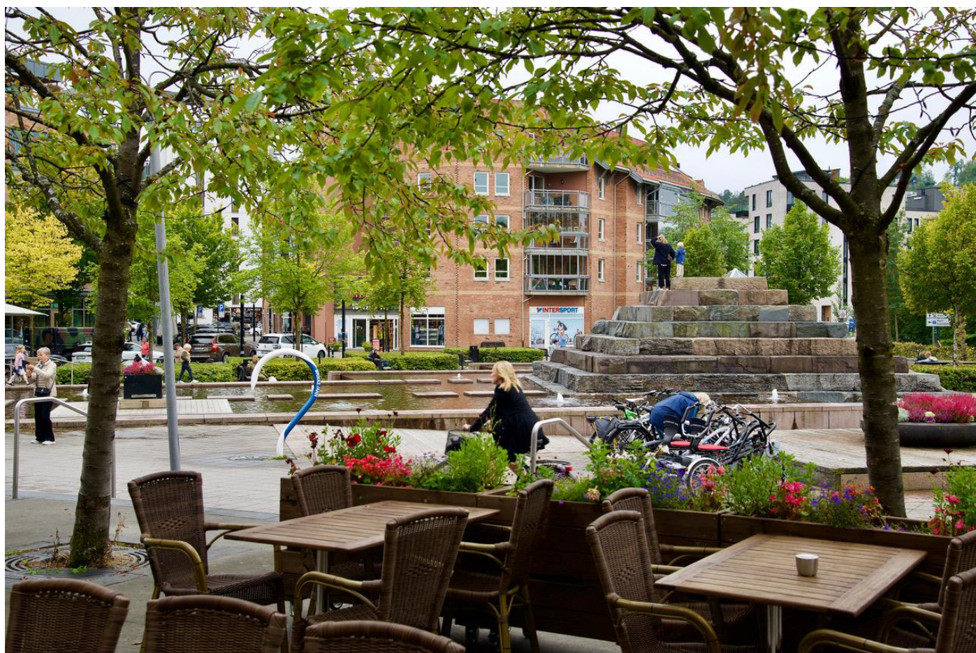
Asker sentrum