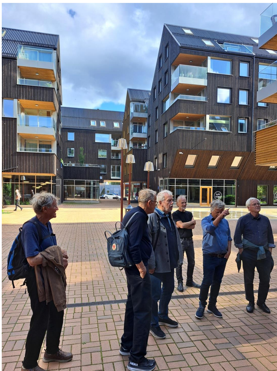
Befaringsdeltakere i Heggedal sentrum, foto: Johan-Ditlef Martens

Også i Heggedal er det satt opp skulpturer, bl.a. av Magne Furuholmen. Det er laget et omsluttet torg mellom de nye boligene der det bl.a. er inngang til innbyggertorg med kafe og saler, Det er også en åpnere plass mot Kistefosdammen, omhyggelig planlagt og utført som et spennende uterom, med torg og park ned mot vannet. Ifølge ordføreren det vakreste torg i Asker, da det ble åpnet med nesten 2000 heggedøler til stede.