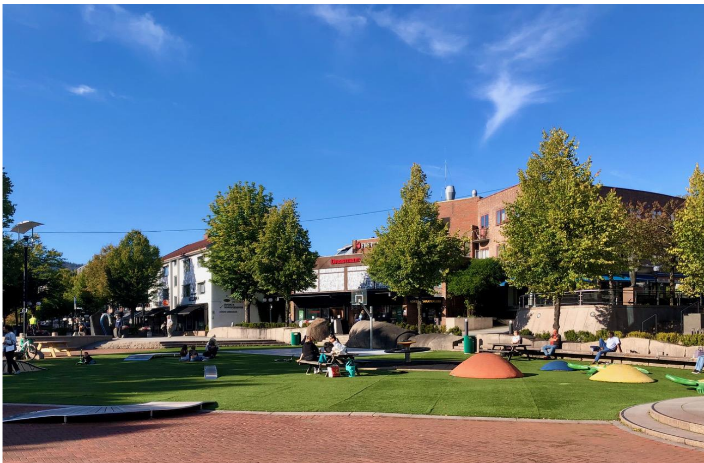
Asker Torg

I den andre enden av Strøket ligger da Asker torg. Hele denne aksen blir stengt for biler når det er 17. mai, marked eller andre arrangementer. Kvartalet nederst mot stasjonen var tidligere preget av kjedelige kontorfasader og parkering. Langs denne delen har Tandberg Eiendom flyttet om på leietakere og fått en mer aktiv bruk av arealene som gir mer interessante fasader, som kaffebar, interiørartikler, apotek, kolonial, og restaurant. De har vært tydelige på hva slags leietakere de ønsker, og velger heller å vente til den rette dukker opp, selv om det kortsiktig betyr tap av leieinntekter. Det har nok vært en lønnsom strategi, for i dag er Asker et attraktivt sted for næringsetablering. Forretningene betaler høyere leie langs gatene enn i Trekanten.